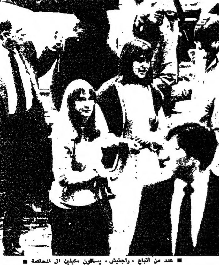
عدد من اتباع راجينش. ويسألون مكيا ان الحصة